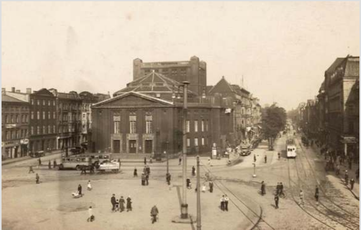
JÓZEF DA DA, KATOWICE - ULICA WARSZAWSKA