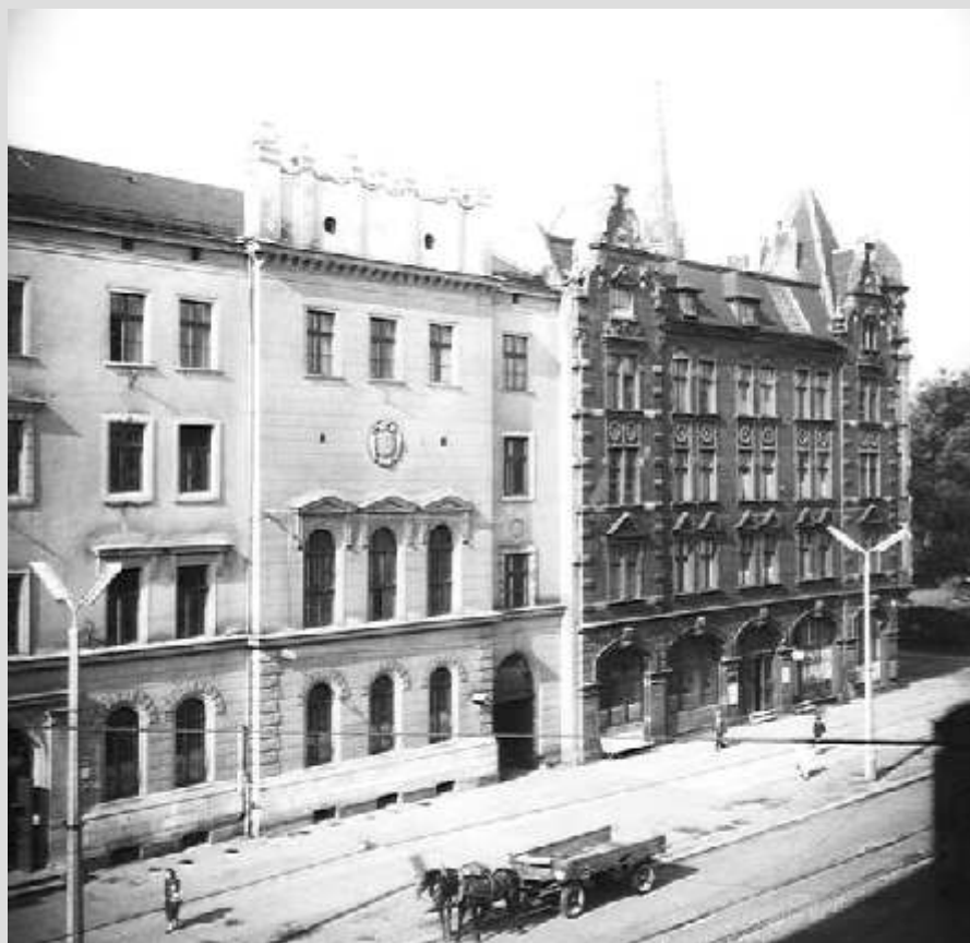
JÓZEF DA DA, KATOWICE - ULICA WARSZAWSKA