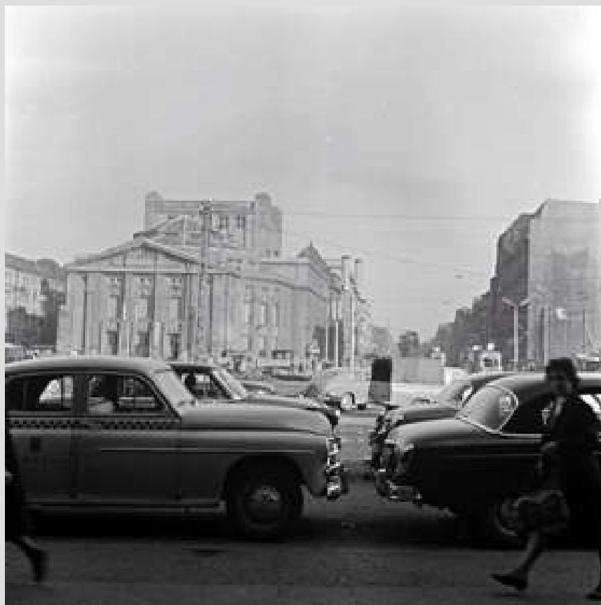
HALINA HOLAS-IDZIAKOWA, KATOWICE - ULICA WARSZAWSKA